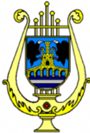
ESTANDARTE Y LOGO OFICIAL